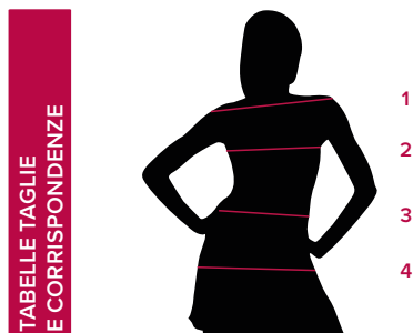
TABELLE TAGLIE E CORRISPONDENZE